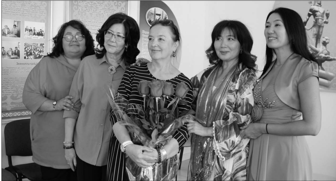
На встрече с выпускниками 1992 г. 27 августа 2022 г.

Много лет отдав радийной стезе, она работала консультантом программ и новостей на телеканалах «Южная столица» (ныне «Алматы») и «Казахстан», вела страницу для родителей «Взрослым о детях» в газете «Суббота плюс», «Столичное обозрение» и «Класс-тайм», была главным редактором журнала «Наш»,