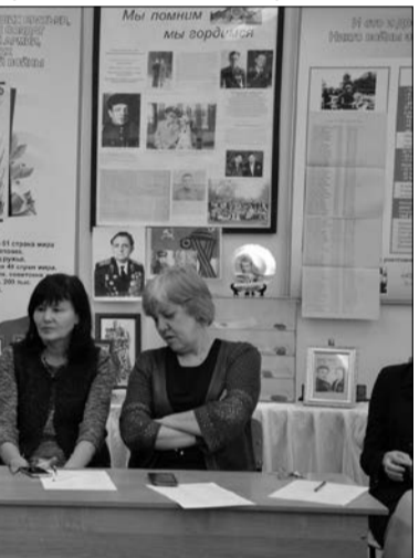
Обсуждение «Бунта невесток»

«Про Федота-стрельца, удалого молодца», «Пока ждёт автомобиль», «Тартюф», «Варшавская мелодия», «Ох уж эти ловеласы!», «Баба Яга пишет» и многие-многие другие. Потом показывали их не только на университетской сцене, но и в школах, общежитиях, детских домах, на торжественных мероприятиях, а также принимали участие в конкурсах. Ежегодно участвовали в международном