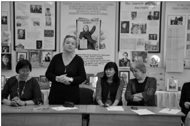
28 апреля 2017 г. на открытом уроке «Язык. Культура. Музеи»

А сколько раз просили другие редакции выручить, подготовить материал, она никогда не отказывала, потому её фамилию можно встретить и в других изданиях страны. Но сколько бы ни соблазняли учредители и главные редакторы перейти на постоянную работу в редакцию, она не поддавалась. И почему так? Потому что