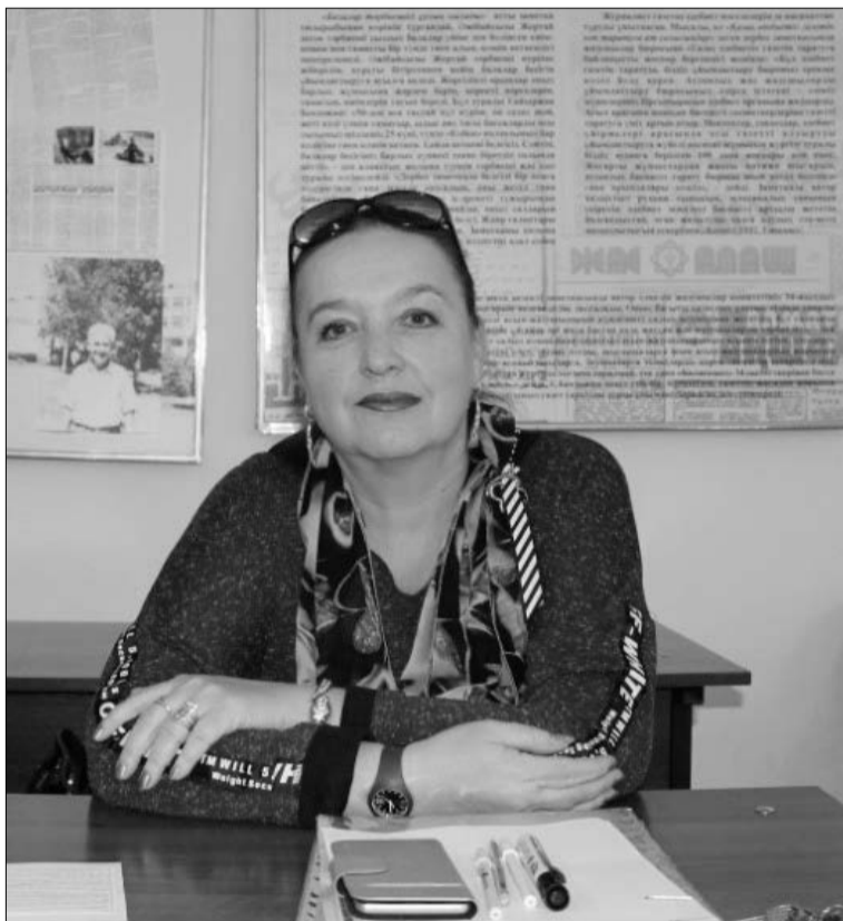
На Краевских чтениях

журналист шёл на задание, важно было не только раздобыть яркую информацию, но и качественно записать на магнитную ленту звук, чтобы в эфире передача прозвучала ярко и чётко.