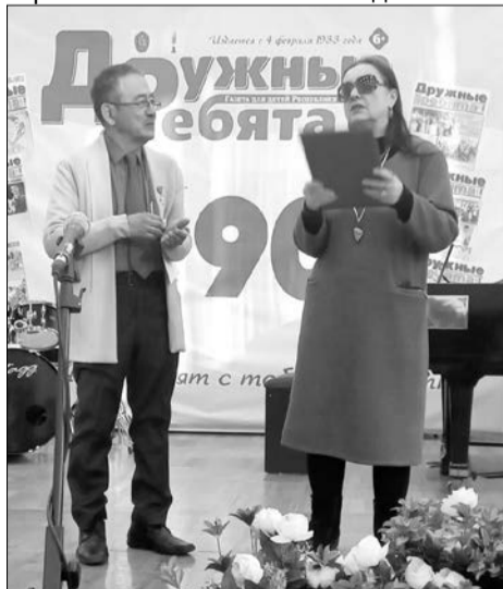
90 лет газете «Дружные ребята»

Её часто хвалили учителя, знакомые, одноклассники, что тоже вдохновляло и воодушевляло. С восьмого класса регулярно сотрудничала с редакцией Кировского радио в России, а со второго курса ежедневно практиковалась в редакции пропаганды Казахского радио в районе алматинской площади Респубблики. И каждый день делала новости. Трудновато современным студентам объяснить, кто такой «репортёр». У них при себе лёгкие сотки, а тогда была тяжёлая бандура-магнитофон, которую репортёр брал в радиоредакции, а ещё под роспись бобины с плёнкой, за которые потом отчитывался. Когда