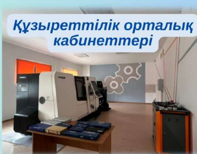
Құзыреттілік орталық кабинеттері